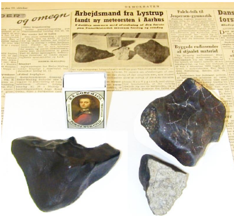
Århus meteoritterne oven på Demokraten fra 19.okt. 1951.