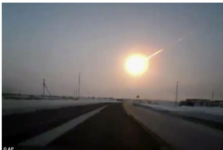
Ildkuglen over Chelyabinsk, Ural

www.bbc.co.uk/news/world-europe-21552923 Her ligger video om meteorit-jagt. BBC 22.febr.2013.