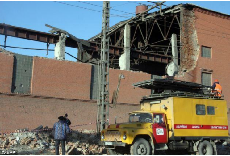
Skader på Zinkværket