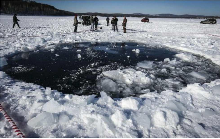
Nedslagshullet i Chebarkul-søen