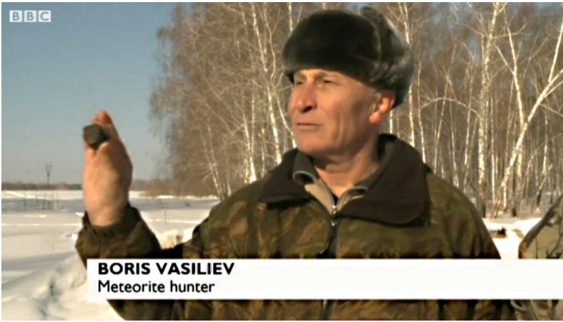
Fund vist på BBC 22.februar 2013